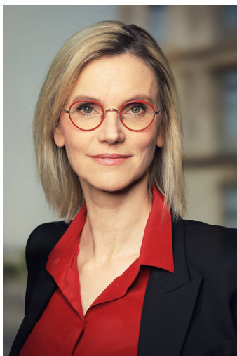
Agnès Pannier-Runacher, ministre de la Transition énergétique